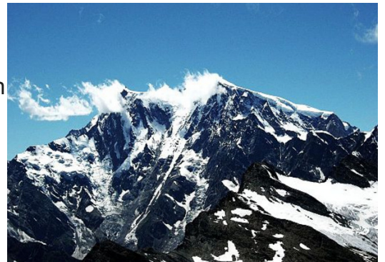
Dufourspitze är Schweiz högsta punkt i Alpena.

Om du reser några timmar västerut från pustan kommer du till bergskedjan Alpena. Där är naturen raka motsatsen till pustan. I Alpena finns höga bergstoppar. Alpena räknas som unga berg trots att de bildades för ungefär 10 miljoner år sedan. Det gör att bergstopparna är höga och spetsiga eftersom de inte har hunnit nötas ner av vind, vatten och snö.