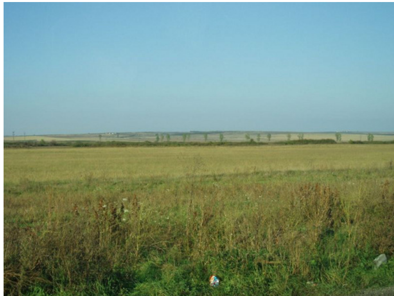
Pustan täcker halva Ungerns yta

I norra Centraleuropa finns det stora områden med slätter. Längre söderut, i Ungern, finns en grässtäpp som kallas pustan. Där växer det mycket gräs och buskar och det finns nästan inga träd alls. I området finns det många gårdar med djur. Det finns bland annat många hästar och får. Andra delar har blivit uppodlade. Förr var det svårt att odla på grund av översvämningar, men nu går det att odla i området eftersom man har grävt diken.