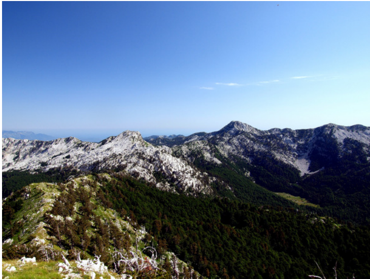
Dinariska alperna ligger på gränsen mellan Kroatien och Bosnien-Hercegovina.

kusterna och vid öarna är det medelhavsklimat. Där är somrarna varma och torra och vintrarna milda. Här trivs bland annat apelsinträd och palmer. Området är också populärt bland turister.