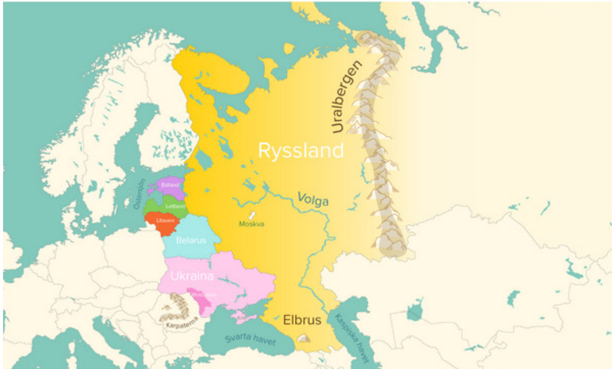
Länderna i östra Europa.

Om den här texten hade skrivits för tjugo år sedan hade den sett annorlunda ut. Kartan här nedan hade också sett ut på ett helt annat sätt. På den tiden ingick länderna tillsammans med flera andra länder i ett stort land som hette Sovjetunionen. Sovjetunionen var ett stort rike fram till 1991. När Sovjetunionen föll bildades i stället femton nya stater: Ryssland, Europas största land, och ytterligare fjorton stater. Några av dem ligger i Europa och andra ligger i Asien.