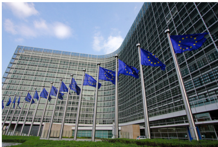
I Belgiens huvudstad, Bryssel, ligger EU:s högkvarter.

Eftersom västra Europa är bland de mest tätbefolkade i världen finns det inte så mycket skog i området. En stor del av ytan är täckt av bebyggelse och här finns miljonstäder som London och Paris. Trots dessa stora städer är det Nederländerna och Bryssel som är mest tätbefolkade. Det beror på att det där bor många människor på en liten yta. Även om Belgien är ett av Europas minsta länder så är huvudstaden Bryssel viktig och kallas ibland för Europas huvudstad. Det beror på att både EU och Nato styrs därifrån.