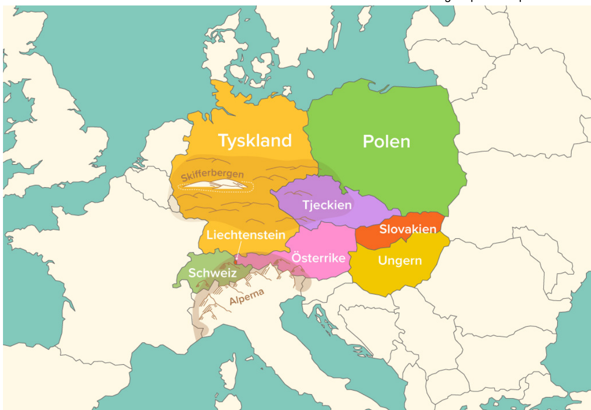
I Centraleuropa finns både höga och medelhöga berg.