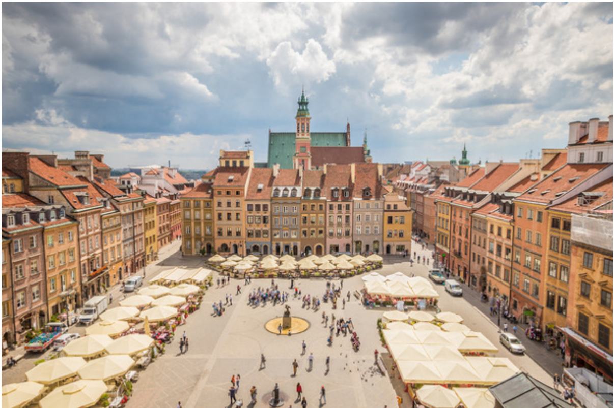
Polens huvudstad Warszawa är en av många storstäder i Centraleuropa.

I Centraleuropa bor det många människor. Därför är området väldigt tätbefolkat. Det bor många människor i storstäder. I städerna har det länge funnits industrier. De har gett arbete åt många människor, men har också gjort att det har blivit mycket trafik i området. Eftersom regionen ligger centralt i Europa är det många bilar och lastbilar som kör genom den.