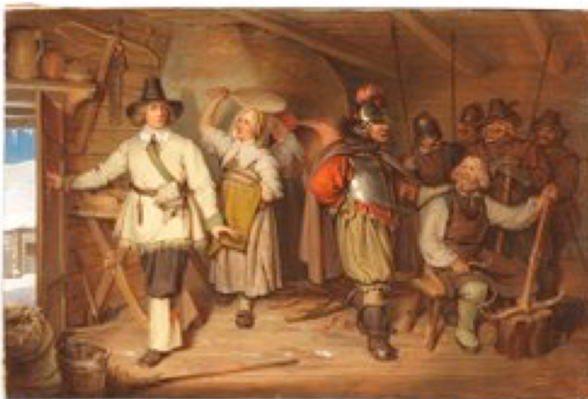
Gustav Vasa blir slagen med en brödspade i Isala.