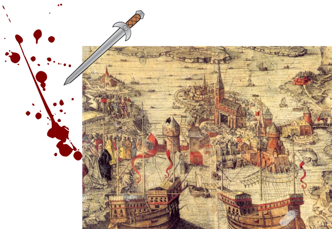
Stockholms blodbad skildrat i "Blodbadstavlan".

Efter blodbadet reste kung Kristian hem till Danmark. Han trodde nu att Sverige skulle vara med i unionen när han gjort sig av med sina fiender. Missnöjet hos svenskarna växte och många var upprörda och arga. En av dem som var upprörd hette Gustav Eriksson Vasa. Han var son till en av de adelsmän som hade halshuggits vid blodbadet.