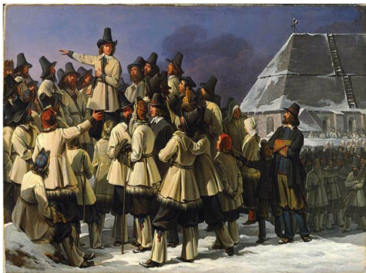
Gustav Vasas tal till bönderna i Mora.

Den 6 juni 1523 valdes Gustav Vasa till Sveriges kung. Det är därför vi firar den 6 juni som vår nationaldag.