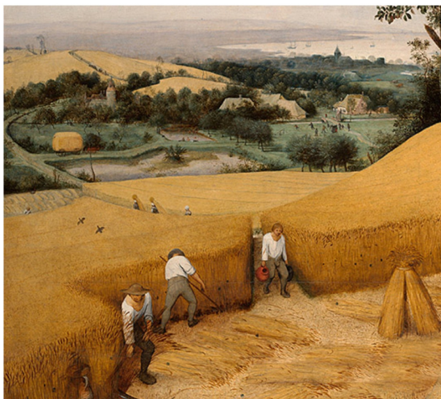
Skördetiden var den mest arbetsintensiva perioden på jordbruksåret.

Bönderna hade långa arbetsdagar under Vasatiden. De kunde arbeta 15 timmar om dagen. Det fanns många helgdagar under året då man ställde till med fest. Många av våra traditioner kommer från denna tiden. Den 1 maj firade man den helige Valborg. Till det datumet skulle bondens inhägnader vara klara så att man kunde släppa ut djuren på bete. Kvällen innan tände man stora eldar för att skrämma bort vilda djur som kunde tänkas vilja ge sig på boskapen. Vi tänder fortfarande idag eldar på Valborgsmässoafton. Julen var en stor högtid precis som idag. Man träffades och åt mycket god mat och dansade och lekte, men någon tomte och julklappar hade man ännu inte börjat med.