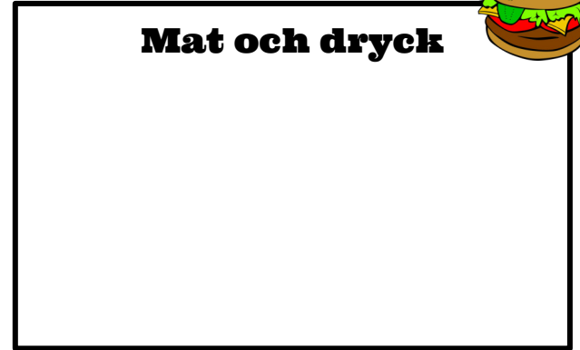
Mat och dryck